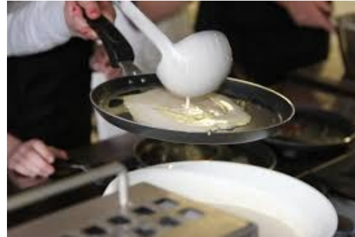
Het juiste proces