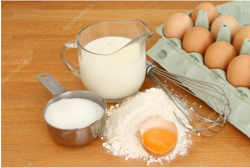
De juiste ingrediënten